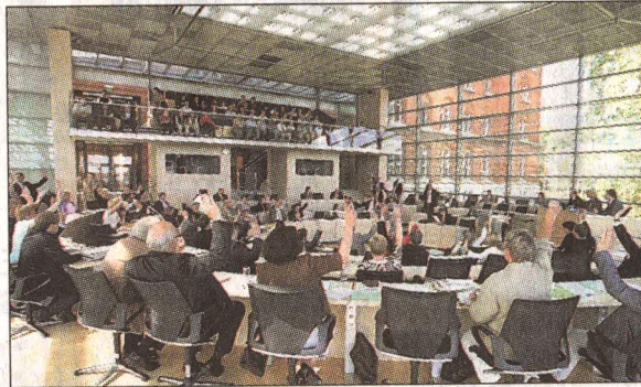
Einstimmig: Der Landtag nimmt einen von den Grünen initiierten Dringlichkeitsantrag an. Jetzt soll morgen über den Streit um die Uni Lübeck debattiert werden.