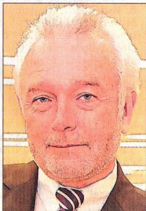
Der Rechtsanwalt Wolfgang Kubicki ist FDP-Fraktionschef im Kieler Landtag.