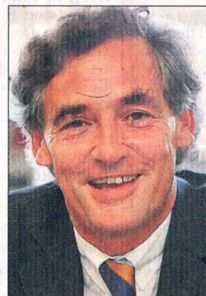
Bernd Saxe (SPD), Bürgermeister der Hansestadt Lübeck.