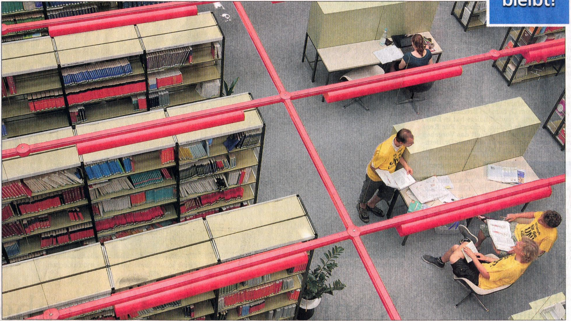
Treffpunkt Hochschulbibliothek: Statt auf Demos zu gehen, ist für die meisten Studierenden nun Lernen angesagt.