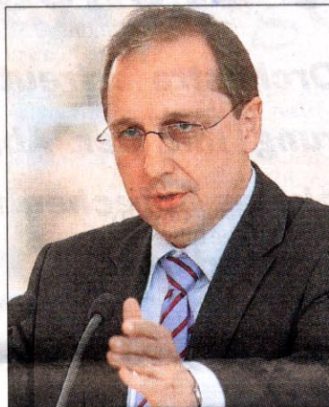
Kiels CDU-Wissenschaftsminister Jost de Jager.

Jost de Jager, CDU-Minister für Wissenschaft in Kiel, will hart bleiben: Lübecks Medizin-Uni wird dichtgemacht, das UKSH soll schon vor 2015 privatisiert werden.